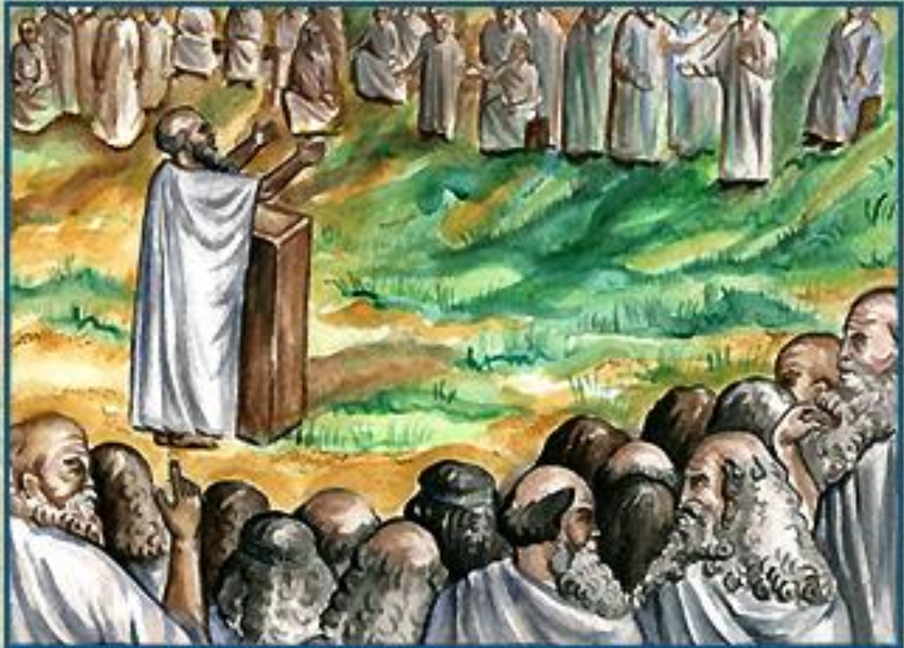
Афинское Народное собрание граждан